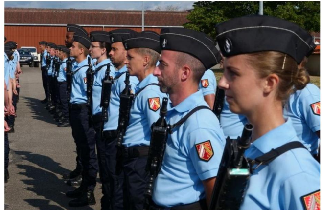
La gendarmerie recrute.