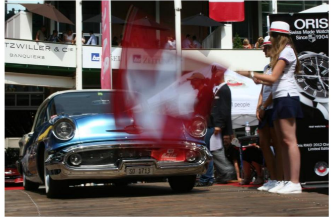
Le Raid Suisse-Paris, qui passera par le pont du Palmrain à Village-Neuf puis se dirigera vers Folgensbourg, permet d'admirer de belles voitures d'époque.

Le lendemain, vendredi 25 août, ce véritable musée ambulante se dirigera vers le Morvan, en passant par la Côte d'Or, pour rejoindre la frontière Bourgogne-Champagne. La journée du samedi 26 août verra toutes ces voitures évoluer à travers les plus belles régions du bassin parisien vers le château de Raray et, depuis là, vers